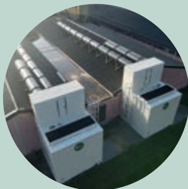
Ventilatoren met verlengde kokers