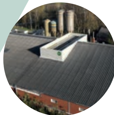
Dubbelzijdige inlaat midden stal