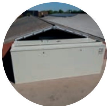
Topgevel met bijkomende spand