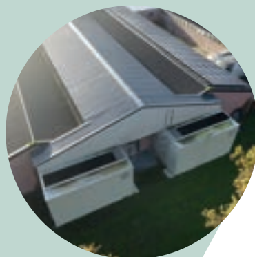
Topgevel via nieuw kanaal