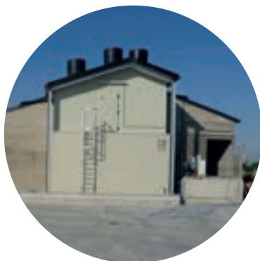
Extra oversteek met luchtinlaat en -uitlaat